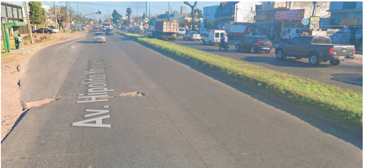
Imagen 4. Deterioro en losas R.P. N° 210, Partidos de Alte. Brown y Pte. Perón.