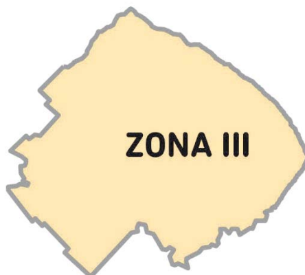
Imagen 2. La Zona III está conformada por los Partidos: ALTE. BROWN, AVELLANEDA, BERAZATEGUI, BERISSO, BRANDSEN, CAÑUELAS, CHASCOMÚS, ENSENADA, ESTEBAN ECHEVERRÍA, EZEIZA, FLORENCIO VARELA, GRAL. BELGRANO, GRAL. PAZ, LA PLATA, LANÚS, LEZAMA, LOMAS DE ZAMORA, MAGDALENA, MONTE, PTE. PERÓN, PUNTA INDIO, QUILMES y SAN VICENTE.