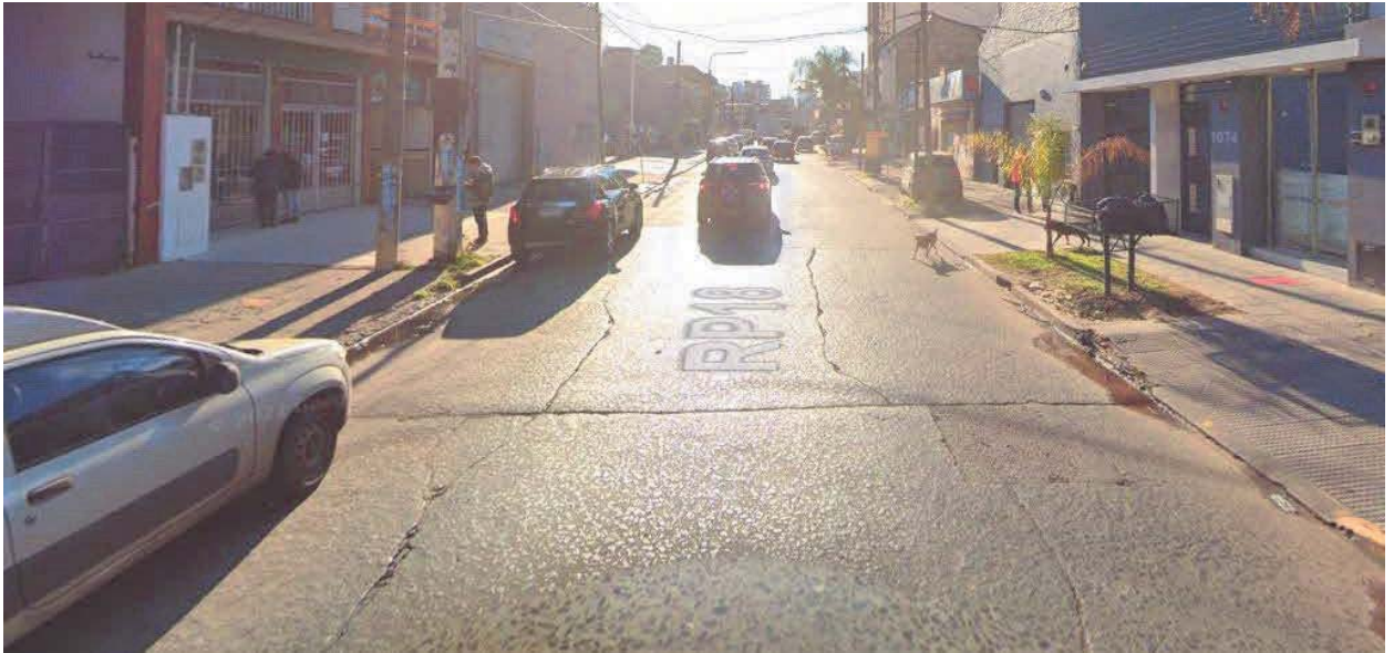
Imagen 3. Deterioro en losas R.P. N° 18, Partido de Quilmes.