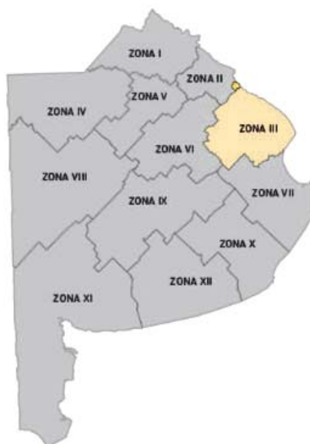
Imagen 1. División de Zonas Viales de la Provincia de Buenos Aires

En las siguientes imágenes se muestra la Zona III sobre la Provincia de Buenos Aires, la cual será el área a intervenir: